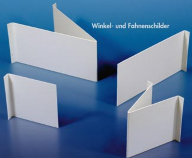
Winkel- und Fahnschilder

... finden Sie auf den Seiten 76, 78, 79