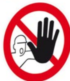
Zutritt für Unbefugte verboten