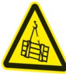
Vorsicht! Schwebende Last