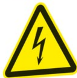
Vorsicht! Elektrische Spannung