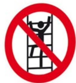
Besteigen durch Unbefugte verboten

- - - Der Baustellenkoordinator gem. § 3 Baustellenverordnung