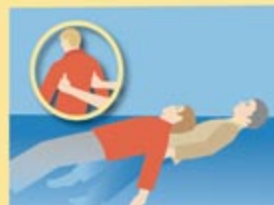
Rettung mit Achselgriff