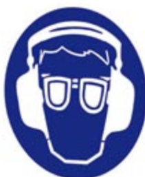
Gehör- und Augenschutz benutzen

Das Baustellen-Sicherheitsschild ist wetterfest und besteht aus einem 4 mm starken geschäumten Kunststoff. Das Schild kann leicht transportiert werden und ist auf jeder Baustelle ein wichtiger Beitrag zur Erhöhung der Sicherheit!