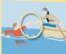
Vom Boot aus retten