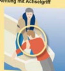
Bergen ins Beiboot