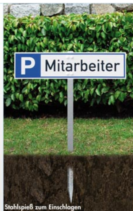
Stahlspieß zum Einschlagen