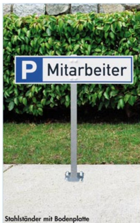
Stahlständer mit Bodenplatte

Stahlständer und Stahlspieß für Parkplatzreservierer